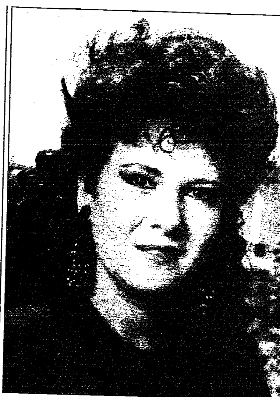
الغناء المصرية دلال عبد العزيز استلقت تصوير دورها في السلسل التلفزيوني «افتح قلبك» الذي يخرج محمد حلمي ويشاركها البطولة خيرية احمد وعبد الحكيم وحسن حسني و ابراهيم بسري ومحمود الجندي وكامل ابورية.